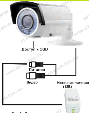
Рис.1 Схема подключения