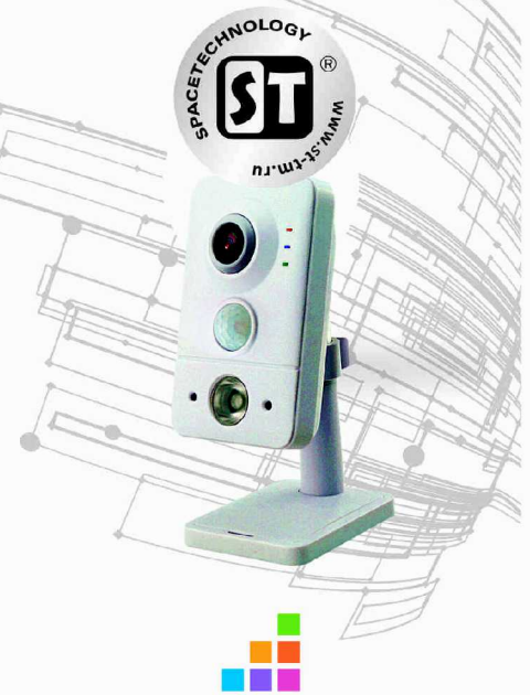
модель: ST-111 IP